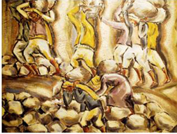
لوحة "العمال" - إنجي أفلاطون

لوحة العمال: يشمل العمل حقائق عن الحياة والمجتمع حيث ينقل الفنان الصور الذهنية والمعاني الاستعارية ويظهر ذلك في مجموعة من الأشخاص يحملون أحجار ثقيلة، وذلك