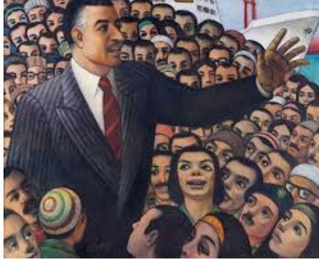
لوحة الزعيم وتأميم القناة- حامد عويس- ١٩٥٧م.

نبض الإنسان المصري البسيط، ومستجيباً لتفاعلات تجرى في المجتمع المصري ولاحتمالات الإنبات والنمو للمشروع النهضوي الثوري في ذلك الوقت. ١٧