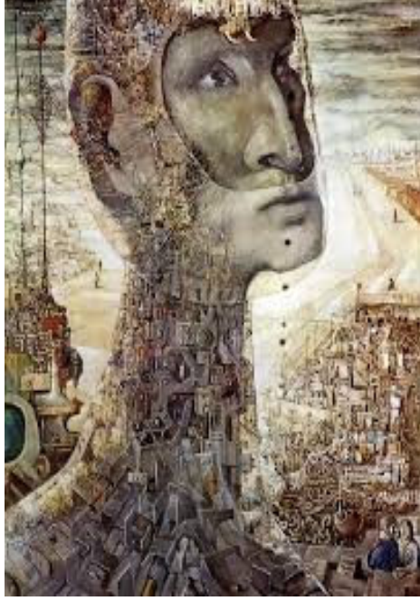
لوحة انسان السد - عبد الهادي الجزار

لوحة إنسان السد: في هذه اللوحة يعبر الفنان عن الإنسان بشخص عملاق تنبض منه الحياة وقد استبدل الشرايين والأوعية الدموية بقنوات من الحديد والمعادن وكأنها هي الأجهزة التي تبني السد العالي، وقد رأى الفنان العمل الجبار في السد والناس تعمل فيه كالنحل النائر حول خلاياه، وتظهر في تكوين اللوحة قيم حسية وجمالية حيث تنظيم الأحاسيس وتجسيدها في صور ذهنية وأشكال وخطوط ورموز، مما يؤدي إلي وحدة الجزء بالكل، وذلك يؤكد أن العمل الفني ليس مجرد مجموعة من الخطوط والألوان والفراغات والرموز، وإنما هو بناء متوحد من العناصر كوقائع ملموسة.